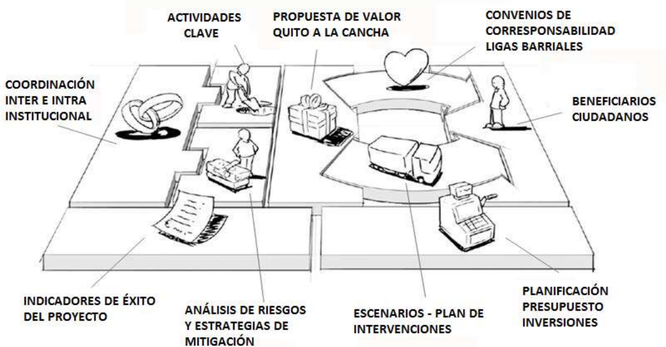
MODELO DE GESTIÓN:

Este Modelo de Gestión se implementará en el Proyecto “Quito a la Cancha”, mismo que incluye infraestructura de canchas de Ecuavoley, estos espacios no se constituyen en escenarios deportivos integrales por lo que serán entregados a las Administraciones Zonales para beneficio de la ciudadanía en general, las cuales a su vez podrán entregar a organizaciones deportivas barriales legalmente constituidas, para su administración, acorde con la firma del respectivo convenio de uso.