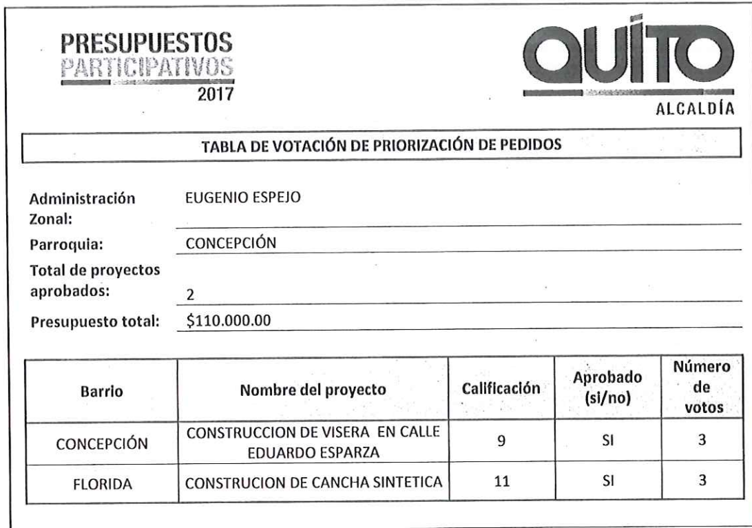
TABLA DE VOTACIÓN DE PRIORIZACIÓN DE PEDIDOS