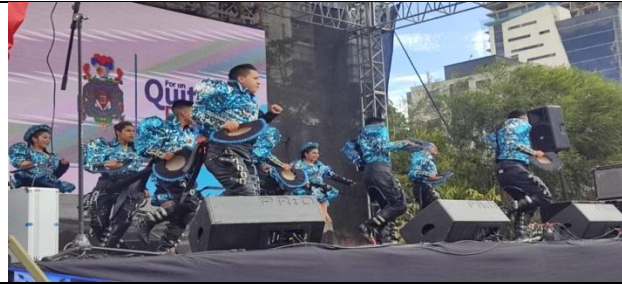
Grupo Nuna Yakupak