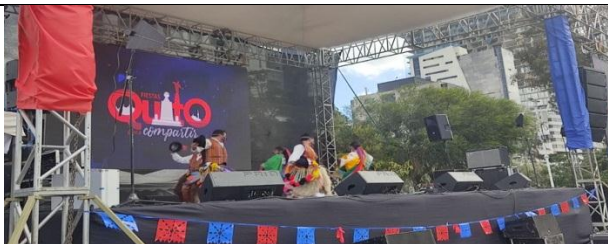
Grupo Apunchipak Puryna