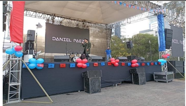
Orquesta La Familia