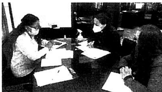
Audiencia Iñaquito Alto