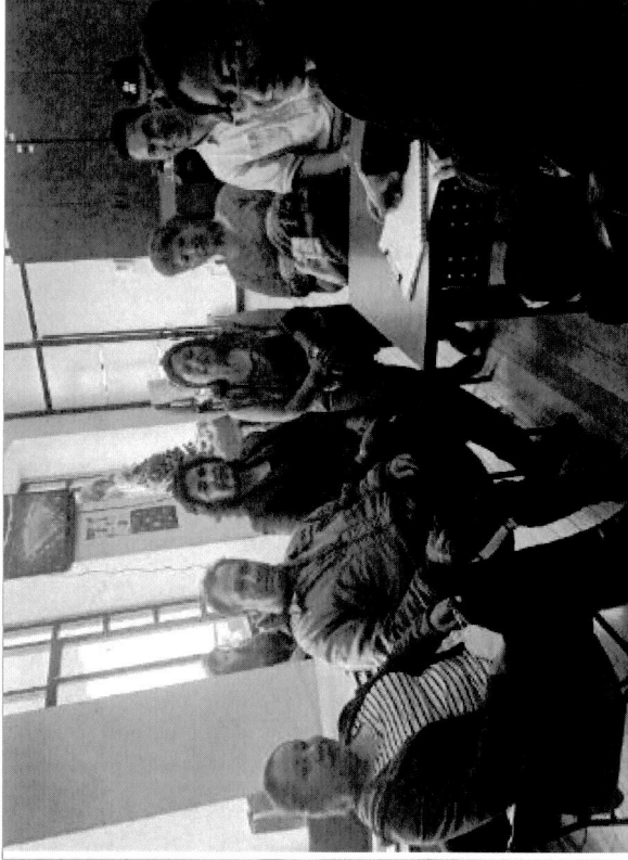
Reuniones de recopilación de información