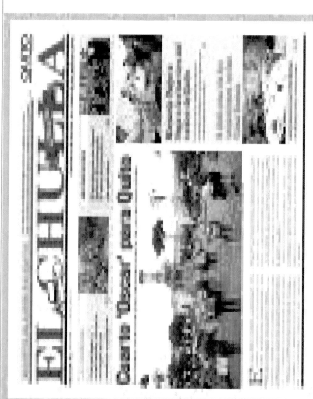
Publicación Periódico Comunitario el Chulla