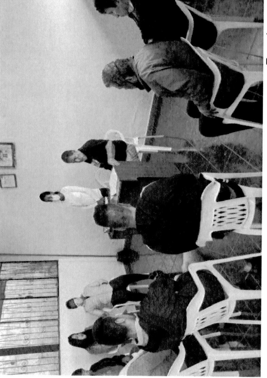
Reuniones de socialización