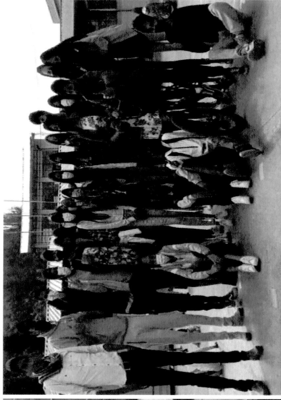
Socialización del Proyecto Social