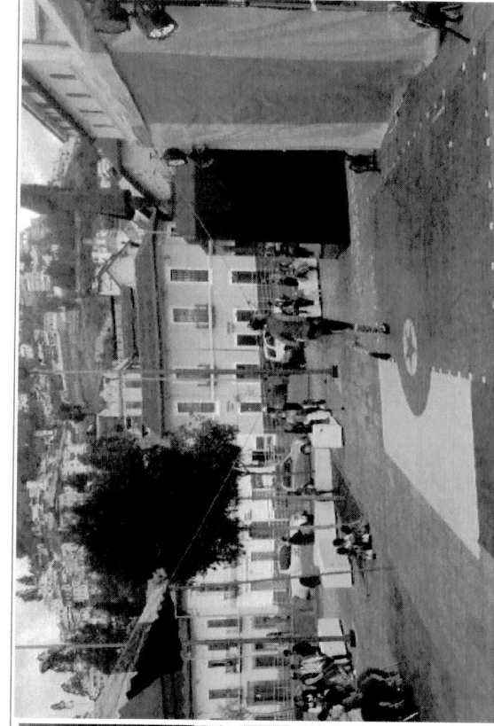
Jornadas culturales y presentación del circo social