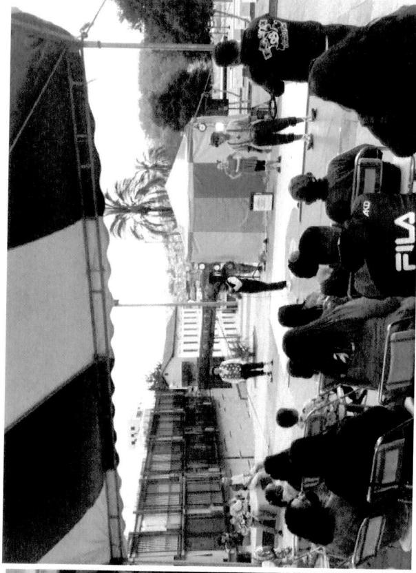
Jornadas culturales y presentación del circo social