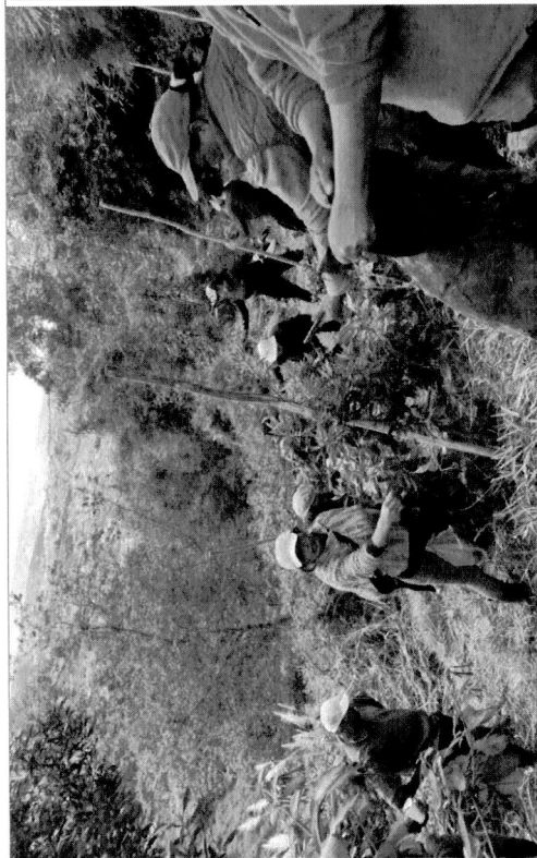
Mingas de limpieza y adcentamiento