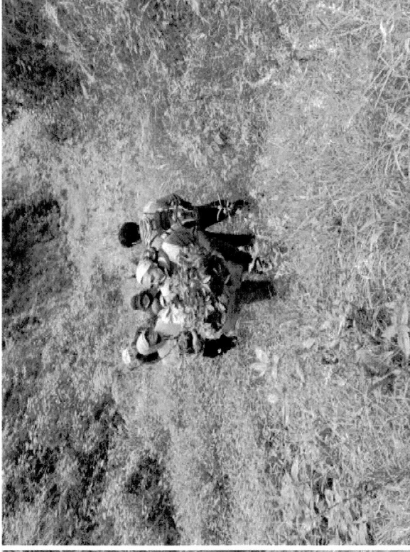
Reforestación y siembra de plantas originarias de la quebrada