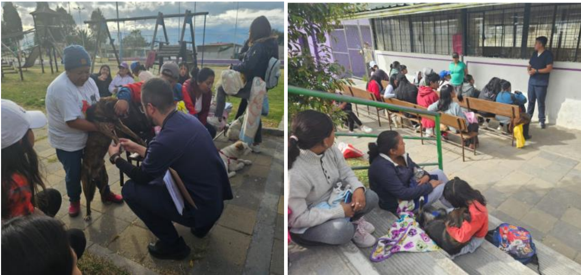
Registro fotográfico campaña de esterilización llevada a cabo en el barrio San Pedro del Valle 09/08/2023.