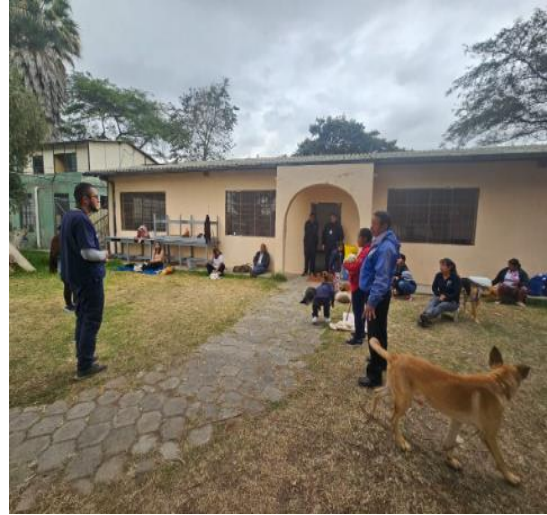
Registro fotográfico campaña de esterilización llevada a cabo en el barrio San Pedro de Inchapicho 15/08/2023.