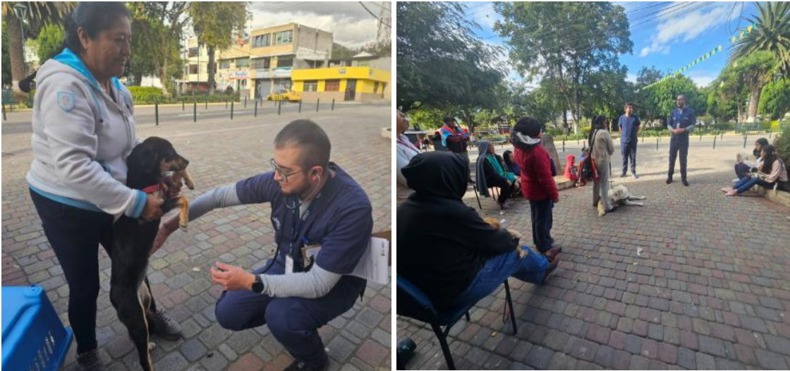
Registro fotográfico campaña de esterilización llevada a cabo en el barrio San Francisco de Tanda el 08/08/2023.