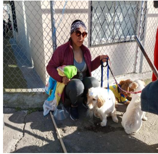
Campaña de esterilización llevada a cabo el 11/05/2023.