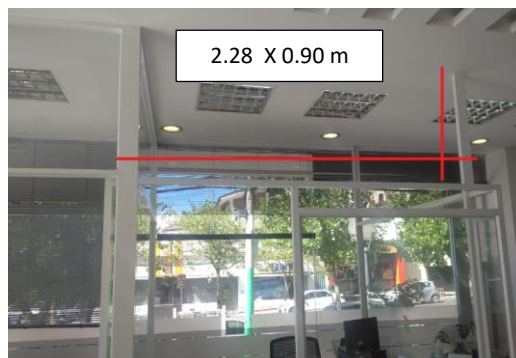
Ilustración 2: Reposición de Vidrio