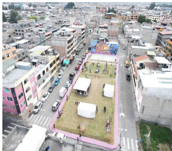
Ilustración 2. Instalación de carpas y equipos de amplificación