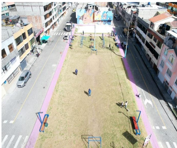
Ilustración 1. Minga de limpieza del parque