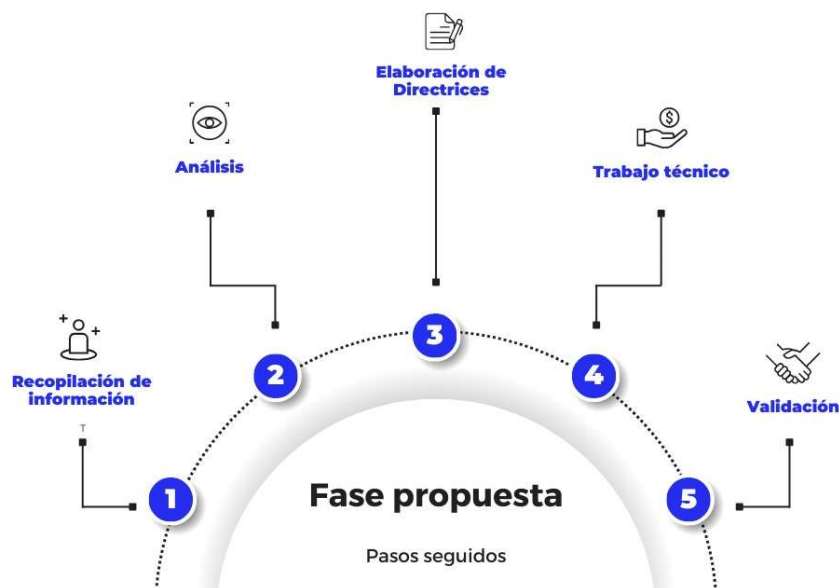
Figura 1. Fases de implementación para formulación/actualización de Metas – Indicadores; Programas – Proyectos; Presupuesto Referencial